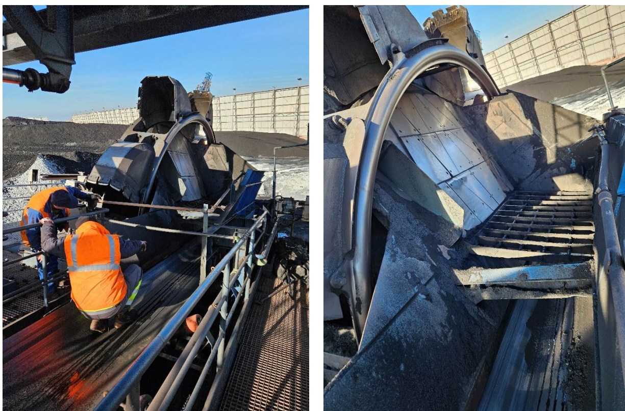
Slika 4. – 5 : Prednji del roke, korčasto kolo kombiniranega stroja

Vsa dela se morajo izvajati tako, da ne ogrožajo varnosti in zdravja ljudi ter, da ni moten delovni proces terminala in na območju pristanišča. Delo se bo izvajalo s prekinitvami in glede na razpoložljivost stroja in operativnosti terminala z umikom opreme izven delovišča. V primeru uporabe iskrečih orodji in opreme je obvezna prisotnost požarne straže (požarno stražo izvaja Luka Koper).